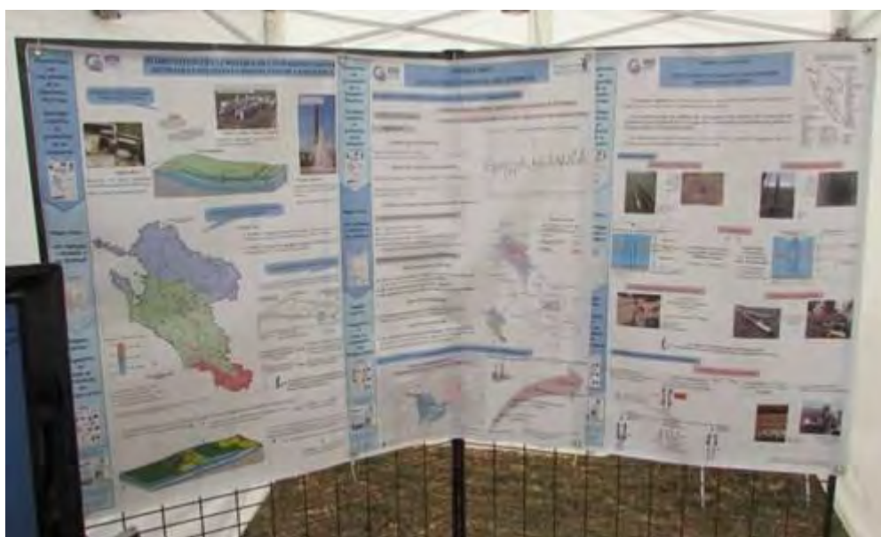
Panneau du stand sur la ressource en eau

Le Syndicat des Eaux a participé au 1 er Salon de l'Irrigation à St Pierre d'Amilly organisé par l'Association Aquanide, pour présenter les actions de protection de la ressource en eau au monde agricole.