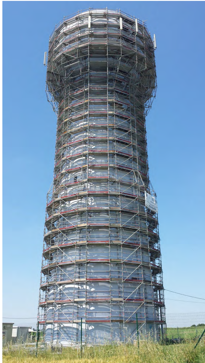
Réservoir de Chenac